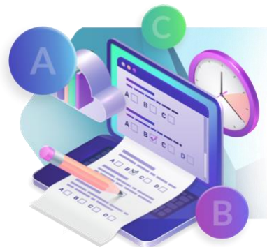
Tabla 35. Distribución total de reactivos por área temática.

A continuación, se muestra la distribución total de reactivos por cada área temática, con el propósito de ofrecer una visión general de la ponderación del instrumento de evaluación.